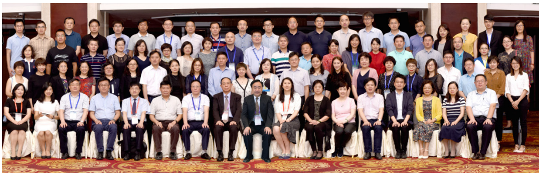
第一届 CONS 成立了！ 2018.8.18 沈阳

CONS专委会未来发展将坚持科学为本、人文关怀以及协作共赢的价值观，以“标准化、精准化、人性化”三大核心为方向完善指南与培训体系；关注患者生活质量价值，推动中国肿瘤支持治疗整合医疗模式发展。通过多维度发力，CONS专委会致力成为连接中国肿瘤临床治疗与患者生存质量提升的关键枢纽。