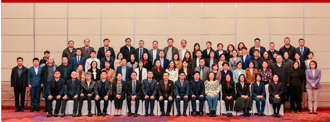
换届选举成立第三届专委会 2025.3.15 上海